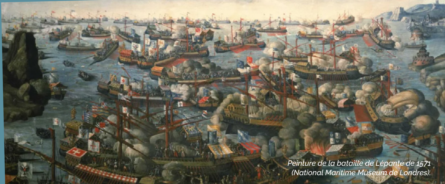
Peinture de la bataille de Lépante de 1571 (National Maritime Museum de Londres).