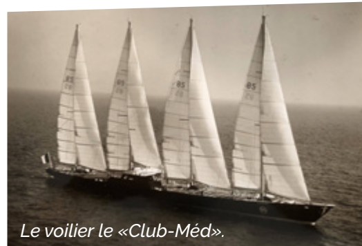
Le voilier le «Club-Méd».