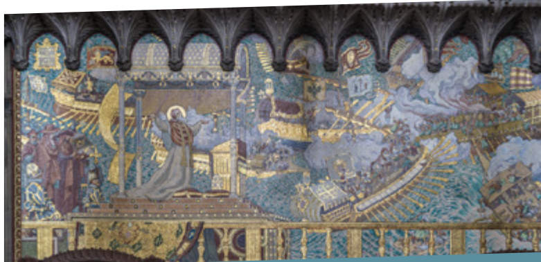
La bataille de Lépante (Basilique de Fourvière à Lyon Jean-Christophe BENOIST, CC BY 4.0)

La victoire de Lépante a un immense retentissement en Europe. Elle apparaît comme un coup d'arrêt décisif porté à l'expansionnisme ottoman. Elle ne met cependant pas fin à la rivalité entre les puissances européennes et l'Empire ottoman, qui vont continuer de s'affronter dans d'autres conflits par la suite.