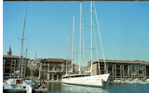
Le voilier le «phocéa».

Michel Bigoin dessinera pour le groupe Bourbon des vedettes rapides, de 30 noeuds, de 10m, 12m, 13,5m, 14,5m, 15,5m, 17,5m, 19,5 m, 23 et 25, ainsi que 3 catamarans de croisière à passagers de 50m, 56m, 58m.